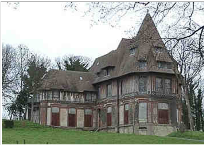
ce n'est pas... la villa La Raspelière