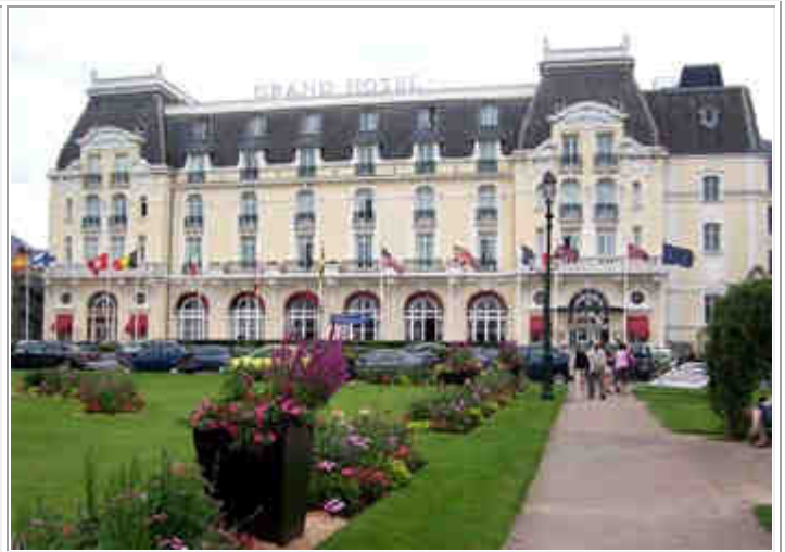
ce n'est pas... le Grand Hôtel de Balbec

Quel est le nom de chacun de ces 2 bâtiments de la Côte Fleurie dans lesquels il est avéré qu'un romancier fort connu s'est couché... mais sans qu'on soit assuré que ce fût "de bonne heure" ?